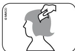
Abb. Durchkämmen des nassen Haares mit Läusekamm vom Haaransatz bis zu den Haarspitzen